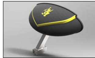
Tableau de bord sur chariot mono