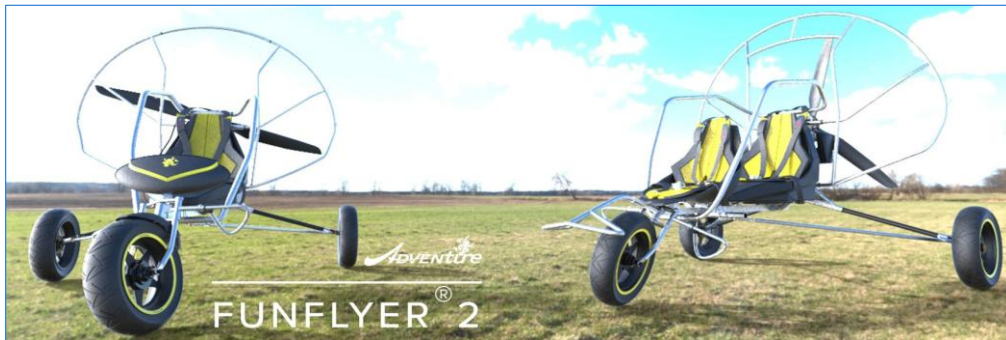
Forfaits port & emballage vers la France métropolitaine (ttc) : paramoteur 187 €, chariot mono 221 €, chariot biplace 242 €