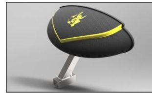
Tableau de bord sur chariot mono