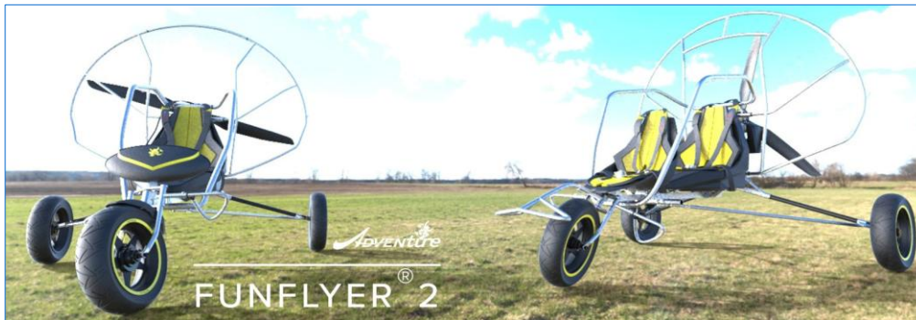
Forfaits port & emballage vers la France métropolitaine (ttc) : paramoteur 187 €, chariot mono 221 €, chariot biplace 242 €